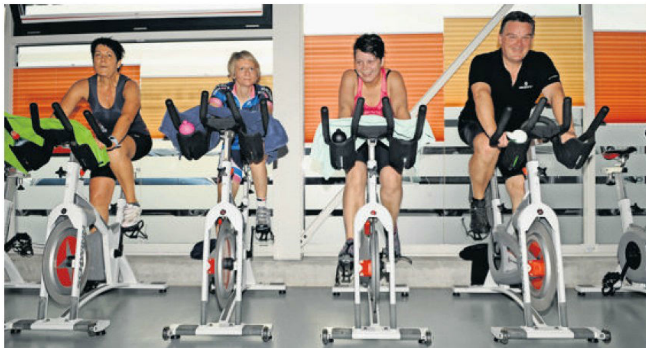
Combinant plaisir et transpiration, près de 200 personnes pourront s'adonner aux joies de l'indoor cycling le samedi 24 janvier, à la salle de la Prillaz à Estavayer-le-Lac.

Cet événement sportif inédit dans la Broye promet une belle ambiance. Quatre-vingts vélos seront à disposition des 200 amateurs qui se relayeront par équipe de deux, trois ou quatre. Un écran géant avec la projection du profil de l'étape animera le marathon, qui se déroulera de 16 h à