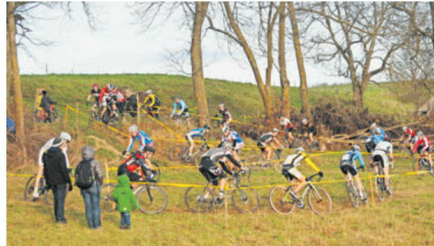
Le parcours à travers champs de Chavannes permet au public d'assister au moindre fait de course.