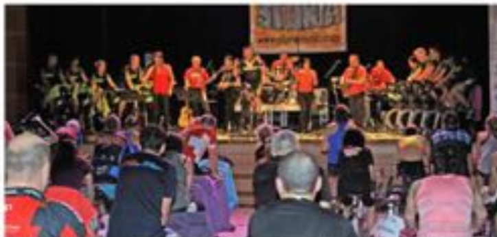
La dernière heure a été moins silencieuse pour les moniteurs, tous réunis sur la scène avec l'orchestre.

Le marathon de samedi reste toutefois un exercice à part. Se retrouver sur scène devant une centaine de personnes attentives lui