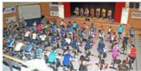
Il y en aura pour tous à pédaler à la Prillaz pour la bonne cause.

BROYE 21'600 La 4 e édition aura lieu le 20 janvier à la salle de la Prillaz. L'événement a été littéralement pris d'assaut.