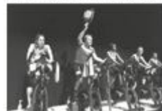
L'ambiance était assurée par des moniteurs

Indoor Cycling Samedi dernier, 250 rouleurs ont participé à la 4 e édition du marathon de spinning «Broye 21'600».